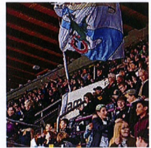
La patinoire doit être agrandie.

SAINT-LÉONARD La ville de Fribourg est prête à investir 15 millions pour agrandir sa patinoire principale, soit autant que le canton. Huit millions seront demandés au Conseil général. Le droit de superficie en vaut sept. >> 11