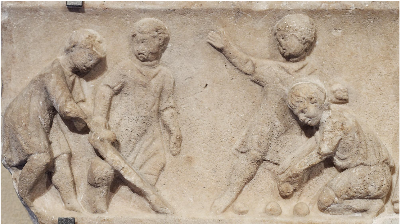
Jeux de lutte et de noix. Sarcophage, Paris, Louvre

CONTACT ET ORGANISATION : veronique.dasen@unifr.ch