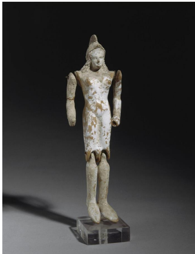
Danseuse pyrrhique ? -450/-400 av. n.è. Attique, Musée du Louvre